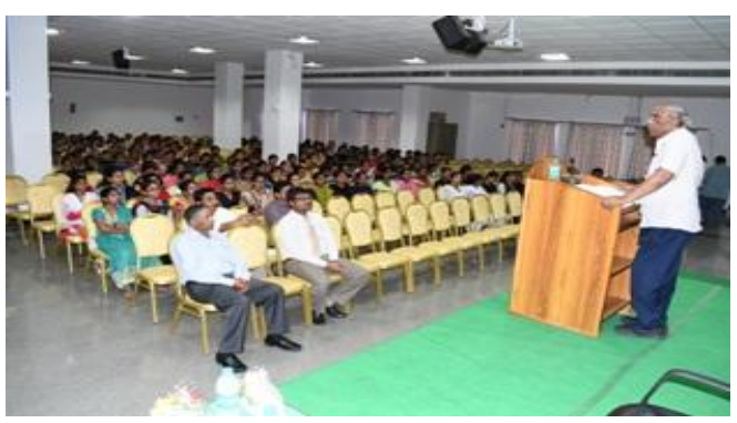
APSSDC Director addressing students