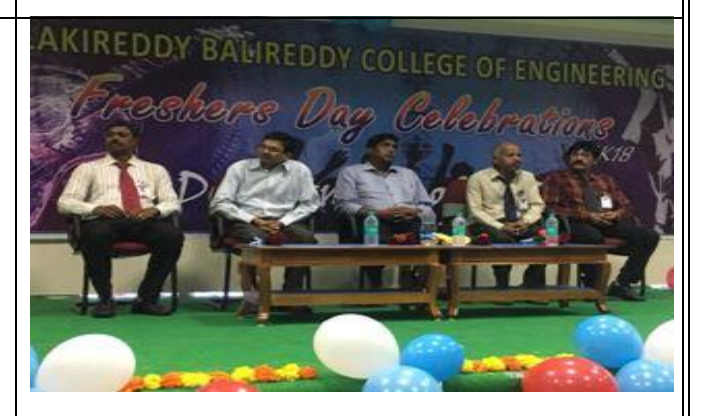
Dignitaries snapped @ the inaugural of Fresher's Day