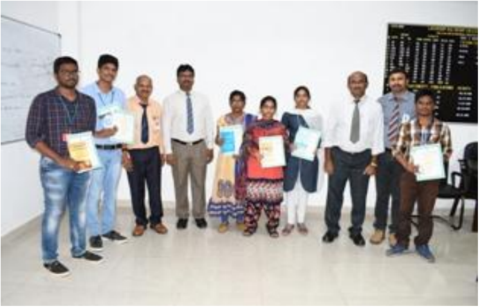
Prize winners posing with Principal & others

LBRCE NSS unit organized a week-long program on "Swaccha Pakwada" in the college campus from 10<sup>th</sup>-15<sup>th</sup> Aug'18.