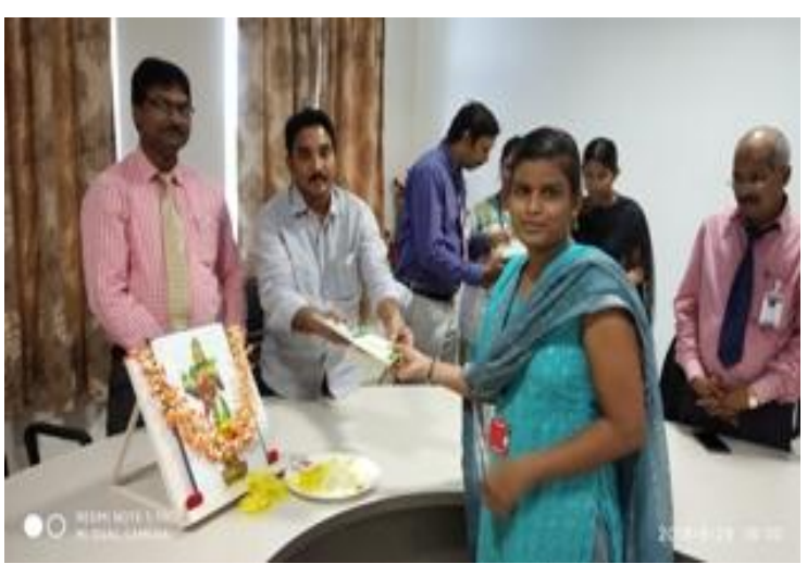
President presenting prize @ Telugu Basha Dinostavam

In order to preserve the priceless Telugu literary traditions and promote their usage among the youth, the LBRCE NSS unit celebrated "Telugu Basha Dinostavam" on 29<sup>th</sup> Aug'18. Students took part in Elocution, Essay writing, Short story telling contests.