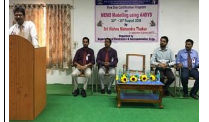
Principal delivering inaugural address@ MEMS workshop

Principal delivering inaugural address@ workshop for NT